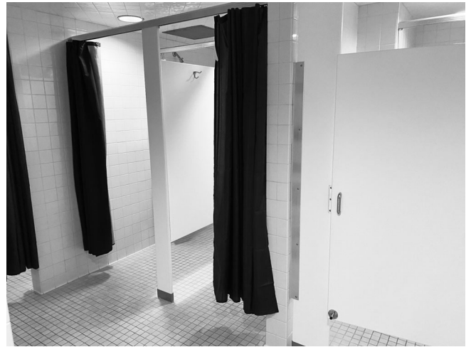
図 10 : スタッフ用宿舎の共用バス、トイレ