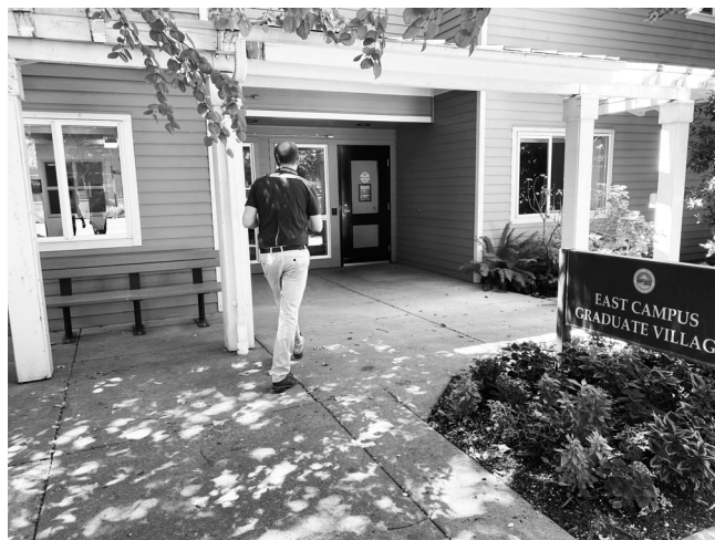
図2：感染者用隔離棟 案内する担当者はマスクをしていない