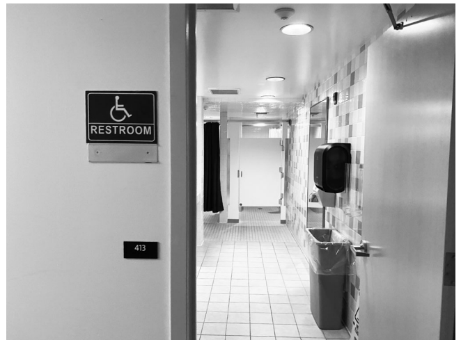
図 11 : 性別区別がない