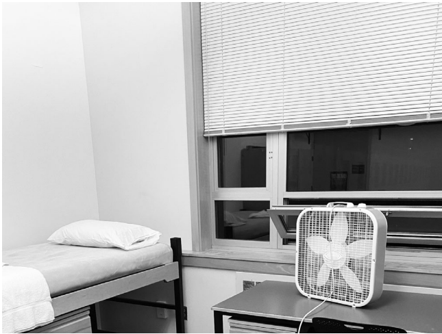
図 8 : 移動前のスタッフ宿舎 2 人部屋 比較的広い