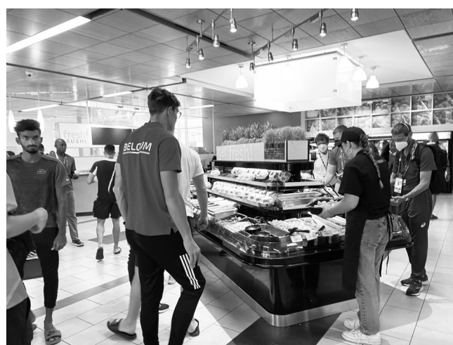
図 7 : 選手村のビュッフェ