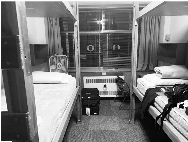
図 9 : 移動後のスタッフ宿舎 1 人部屋だが非常に狭い