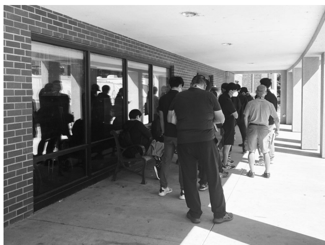
図4：大会後半になるにつれ長蛇の列