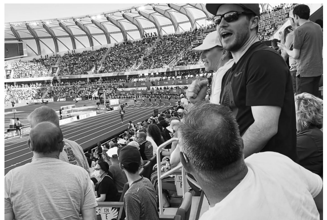
図 12 : スタジアムでの観戦風景 マスク少ない

コロナ感染拡大は比較的落ち着いていると判断されているためか、一定のルールは残っているものの、市中においてマスクをつけていない人が多く見受けられた。(選手役員はあまり立ち入ることはないが) スタジアム内は密状態の中