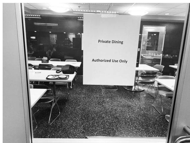
図 6 : 日本選手団は別室で食事となった