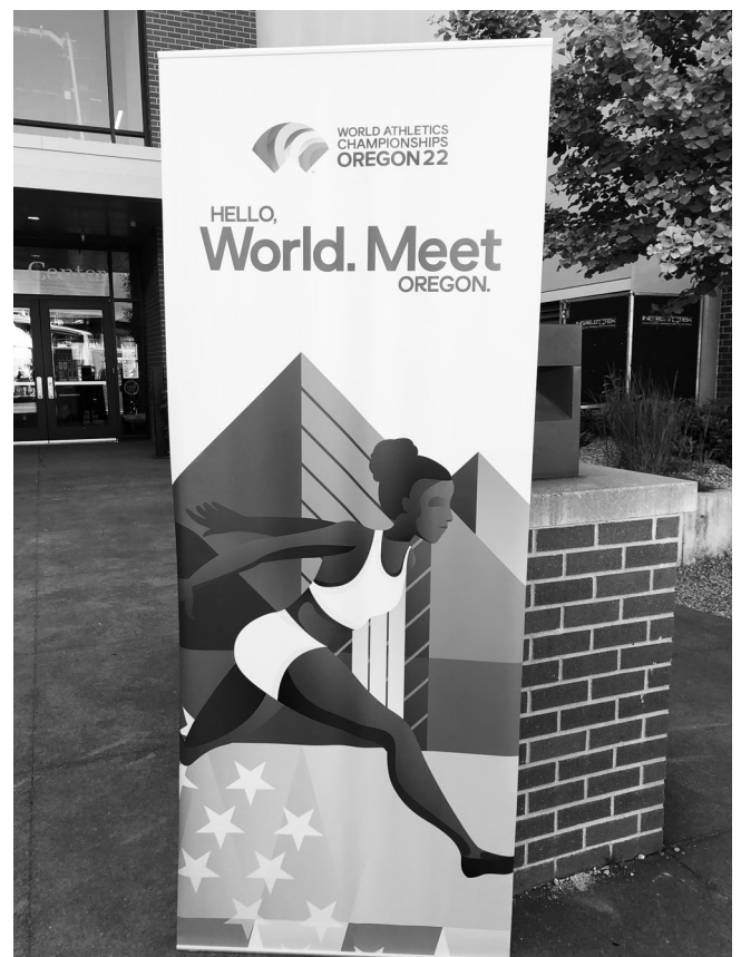
図1：本大会のスローガン

は、選手6名を含む合計20名に感染が確認された。この中には、帰国直前検査の際に判明した者、体調は大きな変化なかったものの有症状の感染者の同室者への検査で陽性になった者も含まれていた。選手団の感染者の中には、咳や強い咽頭痛により間欠的に呼吸の苦しさを訴えた者もいたため、念のため救急病院を受診させ検査等を実施した。他に、数日間高熱が続き食事も喉を通らないような強い症状を出していた者もいたが、幸いに重症には至らず、いずれも安静、加療において症状は改善した。